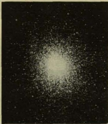
Σχ. 3. Το αστρικό σφουγγαριόμοιο M13 έχει ηλικία 12 έως 14 δισεκατομμύρια έτη.

επαρκεί για τη δημιουργία γαλαξιών από τις μικρές διακυμάνσεις που κατέγραψε ο COBE. Απαιτείται ενίσχυση της βαρύτητας για να επιταχυνθεί η διαδικασία. Εδώ υπεισέρχεται η θεωρία περί «σκοτεινής ύλης» (dark matter) που αμέσως μετά το Big Bang (υποθέτουμε ότι) σχηματίζει «σβώλους», ισχυρούς πόλους βαρυτικής έλξης που επιταχύνουν τις διαδικασίες, μόλις το Σύμπαν γίνει διαπερατό για την ακτινοβολία. Η «σκοτεινή ύλη», η παραδοχή ότι υπάρχουν εξωτικά σωματίδια που δεν έχουν ακόμη ανιχνυθεί, είναι μια υπόθεση που προκύπτει και από τη μελέτη της κίνησης των γαλαξιών, προκειμένου να αιτιολογηθεί η ύπαρξη βαρυτικών δυνάμεων μεγαλύτερων από αυτές που θα προκάλυπτε η συνήθης ορατή ύλη. Ενδιαφέρον είναι το γεγονός, ότι οι παρατηρήσεις του COBE αποκτούν επιπλέον πειθώ αν συνδυαστούν με την (ακόμη) αναπόδεικτη θεωρία της «σκοτεινής ύλης», σύμφωνα με την οποία η ορατή ύλη αντιπροσωπεύει στο Σύμπαν ποσοστό που κυμαίνεται μεταξύ 1 και 10%.