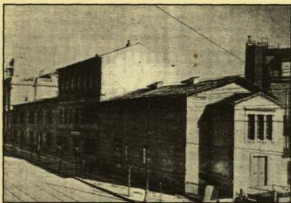
Το κτίριο του παλαιού Πολυτεχνείου στην οδό Πειραιώς

Μαζί με τον Τσέντνερ, το 1843, επαύθησαν και οι ξένοι συνεργάτες του, διδάσκαλοι στη Σχολή, όπως οι λαμπροί αρχιτέκτονες Χριστιανός Χάνσεν, αρχιτέκτων του Πανεπιστημίου μας, και ο αδελφός του Θεόφιλος Χάνσεν, αρχιτέκτων της Ακαδημίας. Μαζί παύθηκε και ο Γάλλος αρχιτέκτων Charles Laurent, διδάσκαλος και αυτός της Σχολής.