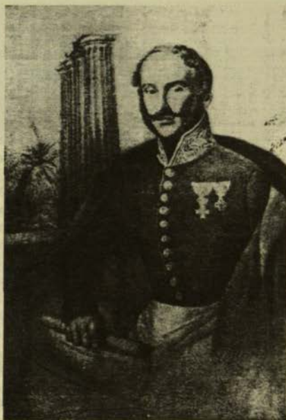
Ο Ιππότης Φρειδερίκος Φον Τσέντνερ

Την έλλειψη ειδικευμένων τεχνικών στην Ελλάδα αντελήφθη καλύτερα ο φιλέλληνας Βασιλεύς της Βαυαρίας και