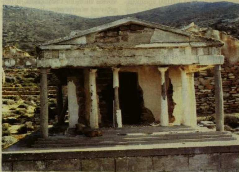
Απομίμηση του Παρθενώνα στο Β' Τάγμα Σκαπανέων της Μακρονήσου.