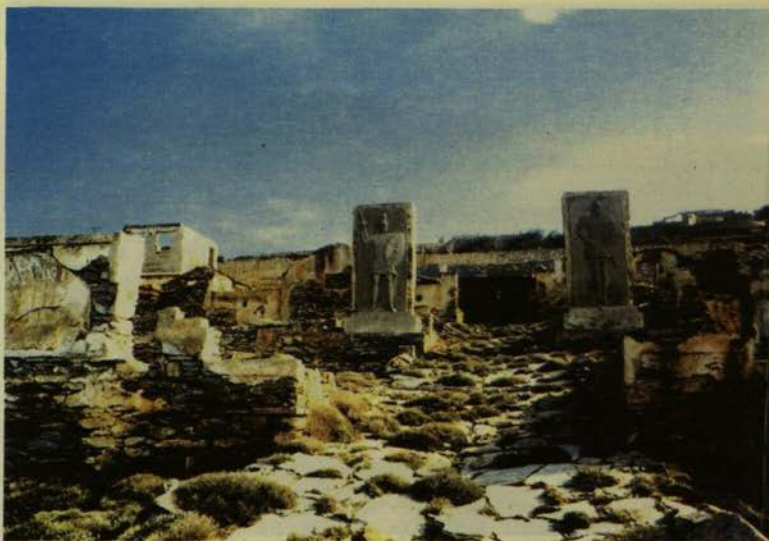
Εμβληματικές παραστάσεις «ελληνικότητας».

«Και μόνο η λέξη Μακρόνησος, με το γεμάτο ιστορική μνήμη νόημά της,