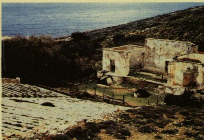
Ένα από τα θέατρα της Μακρονήσου.

«Η Μακρονήσος είναι ένας τόπος ιδιαίτερα φορτισμένος στην πρόσφατη ιστορία του τόπου μας. Οι συνειρμοί και τα συναισθήματα που, ακόμη και το τοπωνύμιο Μακρονήσος δημιουργεί στις δικές μας γενιές, είναι τόσο έντονα, ώστε η ιστορική και κοινωνική σημασία των εκεί διαδραματισθέντων, δύσκολα μπορεί να αποτιμηθεί με τρόπο νηφάλιο και κυρίως, με τρόπο που να συγκεντρώνει ευρύτατη συναίνεση. Είναι, όμως, αναμφισβήτητο σε όλες τις πιθανές εκδοχές της ιστορίας, ότι πρόκειται για ένα τόπο που συνέβησαν γεγονότα βίαια. Όπου η βία ασκήθηκε από την εξουσία για θέματα ιδεολογίας, πίστης και αρχών. Όπου δεκάδες χιλιάδες κρατούμενοι προέρχονταν από όλα τα κοινωνικά στρώματα και, σε σημαντικό ποσοστό, ανήκαν και στη συνέχεια, κατέλαβαν εξαιρετικές θέσεις στη διάνοξη, αλλά και σε όλες τις άλλες σφαίρες δραστηριότητας του τόπου μας. Και όπου η ίδια η μεταφορά των κρατουμένων στο νησί για λόγους πίστης στις ιδέες τους, αλλά και η εκεί καθημερινότητά τους, αναδεικνύουν ένα παράδειγμα ατομικής και συλλογικής πνευματικής αντίστασης στη βία, μεμβέλεια εθνική και παγκόσμια.