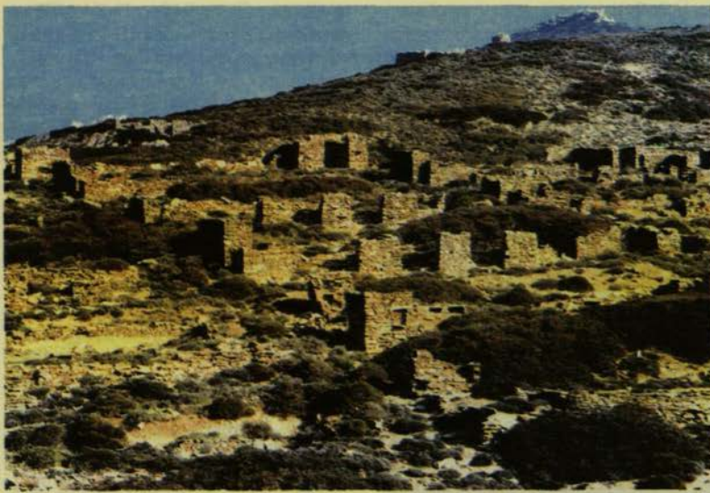
Στρατόπεδον «πειθαρχημένης διαβίωσης». Πολιτικοί εξοριστοί. Διακρίνονται οι χτιστές βάσεις των σκηνών.

δης, είπε ότι, η Μακρόνησος δημιουργήθηκε στην περίοδο του Εμφυλίου Πολέμου, το 1947, και καταγγέλθηκε για φρικτά βασανιστήρια. Η ίδρυση της ΠΕΚΑΜ δεν είχε και δεν έχει σκοπό την αναμόχλευση των παθών και τη διατήρηση κλίματος μισαλλοδοξίας: «Θέλουμε να μην ξεχάσουν οι Έλληνες ότι στον τόπο που γεννήθηκε η Δημοκρατία δεν έχει θέση η βία για την αντίκρουση της αντίθετης γνώμης και ο κάθε πολίτης πρέπει να είναι ελεύθερος να εκφράζει και να διαδίδει τις ιδέες του και τις πολιτικές του απόψεις... Από τη Μακρόνησο πέρασαν περισσότεροι από 100.000 κρατούμενοι, μεταξύ των οποίων, χιλιάδες επώνυμοι παράγοντες της πνευματικής, καλλιτεχνικής, κοινωνικής ζωής, ακόμη δεκάδες αξιωματικοί, στρατηγοί και κληρικοί... Και χρειάστηκε να περάσουν σαράντα ολόκληρα χρόνια μετά τη λήξη του Εμφυλίου ώστε η Πολιτεία το 1989, να ανακηρύξει τη Μακρόνησο, ιστορικό χώρο μνήμης... Είναι χρέος της Πολιτείας να κάνει κάθε τι το δυνατό για τη διάσωση, προστασία και ανάδειξη του ιστορικού τόπου της Μακρόνησου, που να θυμίζει στις σημερινές και τις κατοπινές γενιές, το χρέος ενάντια στη βία, τον καταναγκασμό της συνείδησης και την κατάλυση των δημοκρατικών ελευθεριών, γιατί η Μακρόνησος αποτελεί σύμβολο κατά της βίας».