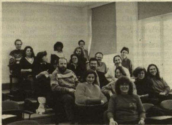
«Σεμινάριο «ΨΥΧΟΛΟΓΙΑ ΤΟΥ ΧΩΡΟΥ».

ή «πώς νοιώθουν οι απόφοιτοι Μηχανικοί, όταν μετά από χρόνια ξανακάθονται στα θρανία του ΕΜΠ»