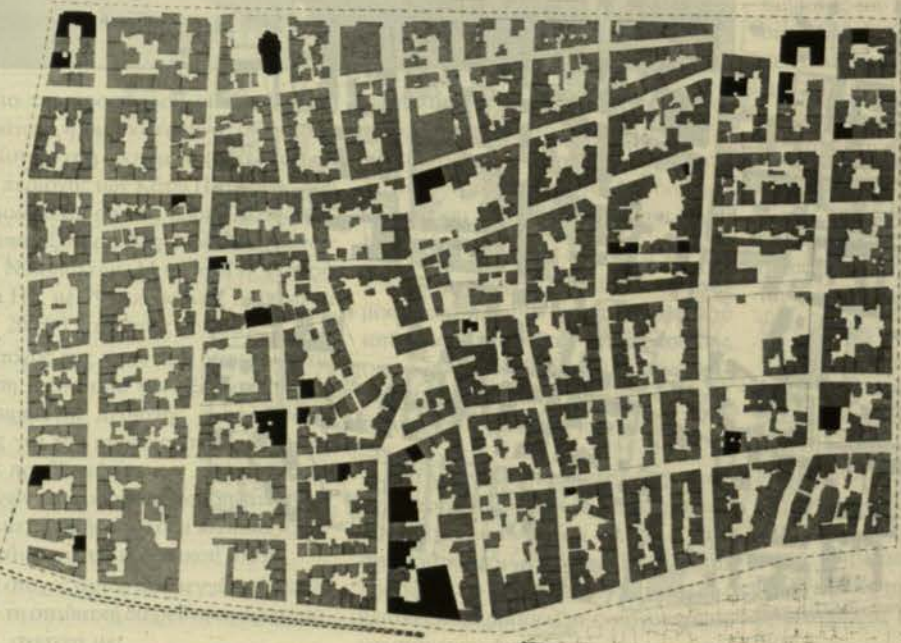
Χάρτης 1, 2: Κατάσταση και κατασκευή κτιρίων.