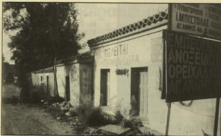
Μικελή και Αγ. Άννης (αριστερή γωνία).

της αντιπαροχής και της συνακόλουθης οριακής εκμετάλλευσης της γής. Διαφωνούμε, ενδεχόμενα όχι με επιμέρους πλευρές, αλλά με τη συνολική φιλοσοφία της ρύθμισης που επιχειρείται μέσα απ' το εν λόγω προεδρικό διάταγμα, κυρίως στο ότι δεν αντιμετωπίζει τις ιδιομορφίες και τις περίπλοκες καταστάσεις που έχουν διαμορφωθεί σήμερα στον Ελαιώνα, και στο ότι επιπλέον, θα συμβάλλει στην παραπέρα συρρίκνωση του παραγωγικού ιστού της πρωτεύουσας, αφού η βιομηχανία του Ελαιώνα -λόγω της αναπόφευκτης ανόδου των τιμών γης- θα υποκαταstitεί σταδιακά απο πιο κερδοφόρες τριτογενείς χρήσεις -κάτι που ήδη έχει αρχίσει να διαφαίνεται. Κατά συνέπεια, η ρύθμιση που επιχειρείται με το προεδρικό διάταγμα, «ελαχιστοποιεί μεν το οικονομικό κόστος της ανασυγκρότησης του Ελαιώνα (και κύρια των κρατικών εισροών σε πόρους), αλλά μεγιστοποιεί το κοινωνικό και περιβαλλοντικό κόστος της ανασυγκρότησης αυτής» (12) . Στην άλλη άκρη του φάσματος, έχουμε τη ρομαντική προσδοκία ενός «πράσινου Ελαιώνα» - δηλαδή μιας οικολογικής «νησίδας» μέσα σε μια απο-βιομηχανοποιημένη μεγαλούπολη, - προσδοκία που δεν απαντά στη σύγχρονη πρόκληση για ανάπτυξη και που δεν επιλύει αλλά μεταθέτει το πρόβλημα σε άλλες περιοχές της Αθήνας.