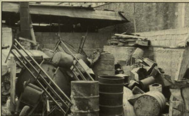
Σιδηρικά στο ακάλυπτο χυτήριο, οδός Κνωσσού.

Η απάντηση δεν μπορεί κατά τη γνώμη μας να αναζητηθεί σε «τεχνικές» ή «νομικιστικές» λεπτομέρειες των κατά περιόδους προτεινόμενων ρυθμίσεων. Θα πρέπει να αναζητηθεί κατ' αρχήν στον τρόπο συγκρότησης της «κοινωνίας των πολιτών» και του κράτους στη σύγχρονη Ελλάδα, καθώς και στις μεταξύ τους σχέσεις. Η συγκρότηση αυτή χαρακτηρίζεται από τα ακόλουθα βασικά στοιχεία: