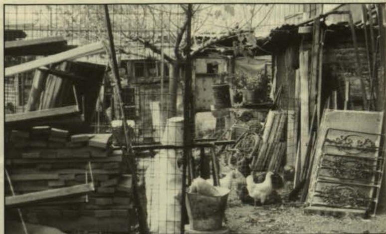
Δημαράκη (γωνία με αδιέξοδο). Αφού Τσαντίλη, εκτροφή και σφαγή ζώων, συντήρηση κρεάτων.

Ο Ελαιώνας, σήμερα, «πληρώνει» το τίμημα των παραπάνω διαρθρωτικών προβλημάτων της σύγχρονης ελληνικής κοινωνίας. Η έλλειψη μιας στοιχειώδους συναντίληψης γύρω απ' τη φύση και το χαρακτήρα των προβλημάτων της περιοχής, εντείνεται από την παραπληροφόρηση και την παραφιλολογία. Μέσα σ' αυτό το κλίμα, είναι πρόσφορη η κυριαρχία ακραίων λογικών: Από τη μια, το Προεδρικό Διάταγμα 74Δ/1991 (γνωστό και ως Διάταγμα Μάνου), επιχειρεί να επιβάλει «λύσεις» στο περίπλοκο πρόβλημα «Ελαιώνας» με μεθόδους και «εργαλεία» της 10ετίας του 1960, δηλαδή τη μέθοδο