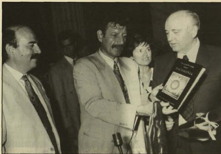
Ο Πρωτάνης ΕΜΠ προσφέρει στο Μιχαήλ Γκορμπάτσωφ των τόμο Μακεδονία που εκδόθηκε από το ΕΜΠ.

τα βιβλία και μετά να επιβληθεί στην κοινωνία. Θα είναι μία επικίνδυνη αντικατάσταση εννοιών, που θα οδηγήσει στην έλλειψη ευθύνης και στον θρίαμβο των εγωιστικών επιδιώξεων.