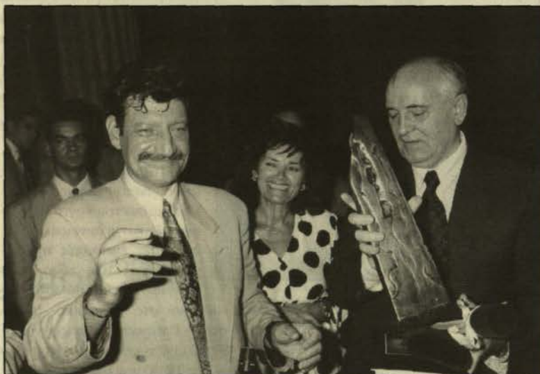
Απονομή τιμητικού διπλώματος, μεταλλίου του ΕΜΠ και έργου μικρογλυπτικής στον Μιχαήλ Γκορμπατσώφ από τον Πρύτανη ΕΜΠ. Το γλυπτό φιλοτεχνήθηκε από το γλύπτη Γ. Καλακαλλά.

Θυμάμαι τα λόγια σας, Μιχαήλ, στο εισαγωγικό σημείωμα της «ΠΕΡΕΣΤΡΟΪΚΑ». Είπατε: «Για την αντιμετώπιση των τρομακτικών κινδύνων από τα συσσωρευμένα όπλα του πυρηνικού ολέθρου, χρειάζεται διάλογος και