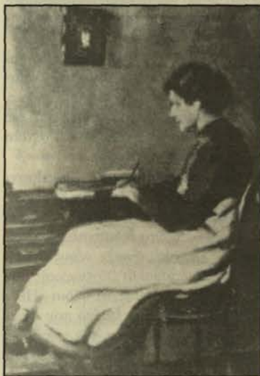
«Γραφείο». Λάδι της ζωγράφου που εκτέθηκε το 1923 στη Διεθνή Έκθεση Λονδίνου.

As αναφέρω όμως μερικά βιογραφικά στοιχεία για την καλλιτέχνη: Γεννήθηκε στην Αθήνα τον Ιούνιο του 1898. Υπήρξε μέλος μιας καθαρής καλ-