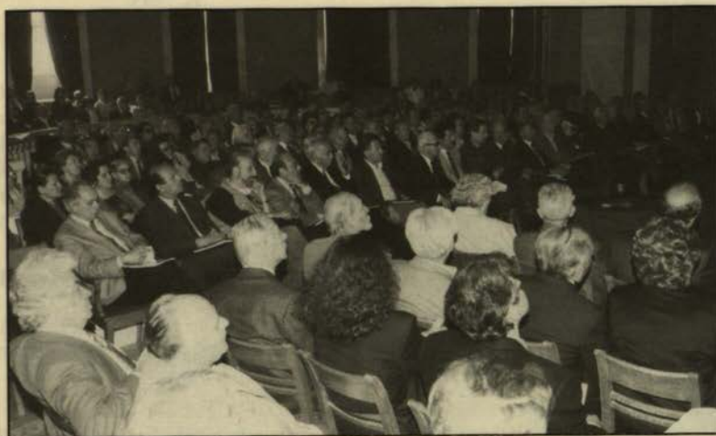
Από την ημερίδα για την προστασία και ανάδειξη του ιστορικού τύπου της Μακρονησού (28.4.93).

σης. Η Σύγκλητος λοιπόν δέχθηκε ότι Μεταπτυχιακές Σπουδές Ειδίκευσης είναι κατανοητό να διοργανωθούν μόνο σε διεπιστημονικά θέματα στα οποία θα απαιτηθεί συνεργασία δύο ή περισσότερων τμημάτων. Ακόμα αποφάνθηκε ότι θα διευκολυνθεί η συνεργασία των συναρμοδιαίων φορέων (εργαστηρίων, μελών ΔΕΠ, κλπ.) αν ιδρυθούν ανάλογα Ινστιτούτα. Προφανώς τα Ινστιτούτα θα διευκολύνουν και την εκπόνηση των αντίστοιχων Διδακτορικών Διατριβών.