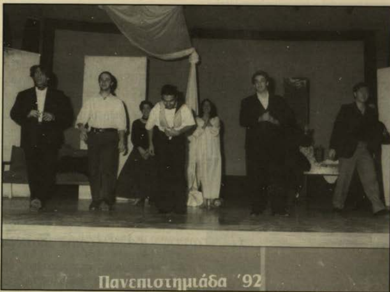
Από τις εκδηλώσεις της Πανεπιστημιάδας (1992).

Το κατάστημα Υπολογιστών είναι υπό προκήρυξη.