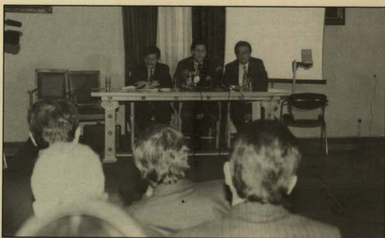
Εκδήλωση για την οικολογική βεζίνη (7.12.93).

Τα Τμήματα Χημικών Μηχανικών, Ναυπηγών, Πληροφορικής, προχώρησαν στην οργάνωση Βιβλιοθηκών. Κατάλληλο χώρο διαθέτει και το Τμήμα Μεταλλειολόγων.