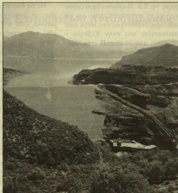
2: Φράγμα Κρεμαστόν στον ποταμό Αχελώο