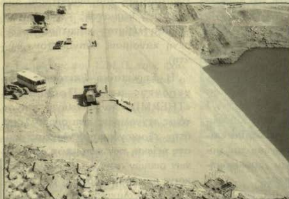
1: Φράγμα Μεσοχώρας στον ποταμό Αχελώο (υπό κατασκευή). σωστές λεζάντες

Στη συνέχεια παραθέτουμε τις φωτογραφίες με τις