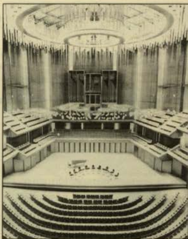
Εικ. 4. Εσωτερική άποψη της αίθουσας συναυλιών Roy Tomson, Toronto, στον Καναδά, 1982 (M. Forsyth).

Παράλληλα, όπως εκτίθεται στο ίδιο κείμενο 2 , ο προικισμένος ειδικός που με το έργο του διακονεί την ομορφιά του ήχου, δεν είναι δυνατόν να υπολείπεται και σε μουσική ευαισθησία και αντίληψη. Αυτή καλλιεργείται μέσα από την αναζήτηση της γοητείας του ήχου στα τεμένη της λατρείας του υποστασιοποιείται όμως, μόνο για εκείνους που έχουν το χάρισμα να «βλέπουν» (και να «ακούουν») ιδιαίτερα με τα αισθητήρια της ψυχής, όπως ανάγλυφα περιγράφεται αυτό σε σύγχρονο φιλοσοφικό κείμενο: «On ne voit bien qu'avec le coeur. L'essentiel est invisible pour les yeux» 6 . Σημαντικότερο όμως όλων, για εκείνον που θα διδάξει την Αρχιτεκτονική Ακουστική αλλά και για κάθε