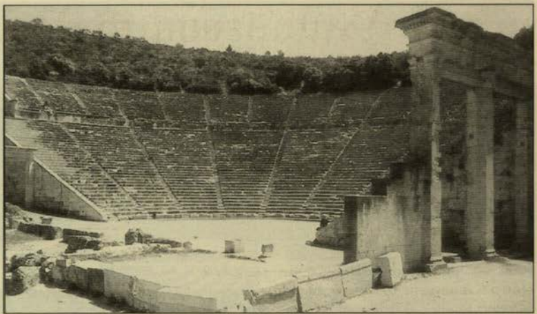
Εικ. 1. Γενική άποψη του αρχαίου θεάτρου της Επιδαύρου

Μνημειώδες παράδειγμα στο προκείμενο, από την δική μας ιστορία, αποτελεί το περιώνυμο αρχαίο θέατρο της Επιδαύρου. Φορέας και σύμβολο του κλασικού Έλληνικού πνεύματος, όπως αυτό εκφράστηκε μέσα από το αρχαίο δράμα και ενσαρκώθηκε μέσα από την αναζή-