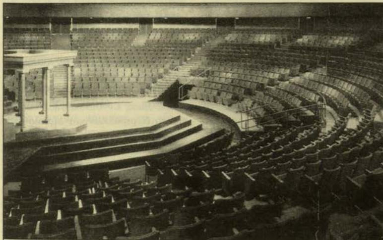
Εικ. 2. Εσωτερική άποψη του Shakespearean Festival Theatre, Stratford, Ontario, στον Καναδά, 1957 (R. and H. Leacroft).

Θέλουμε και μπορούμε να πορεύσουμε, ηνιοχώντας τη γνώση, προς την «Επίδαυρο» του 2000 - το σύμβολο και εκφραστή της λαμπρότητας του Ελληνικού πνεύματος, μέσα από έργα αρχιτεκτονικής ταγμένα στη λατρεία του ήχου, που απαιτούν εμπειριστατωμένη τεχνολογική γνώση, αρχιτεκτονική δεξιότητα και ευαισθησία στο ευγενικό και ανήσυχο Ελληνικό πνεύμα. Η παρουσία μας αυτή, μπορεί να αποτελέσει ευγενή συνεισφορά στην ιδέα της Ενωμένης Ευρώπης που σήμερα αυτοπροσδιορίζεται και υλοποιείται, καθώς και ακλόνητη μαρτυρία της θέσης μας, γεωγραφικά, ιστορικά και πολιτιστικά, στην εποχή των διεθνών αμφισβητήσεων και ανακατατάξεων ευρύτερα δε, είναι δυνατόν ένα τέτοιο παρόν να συμβάλει και πάλι στον εξανθρωπισμό της οικουμένης, που θα στρέψει το βλέμμα με ενδιαφέρον προς εμάς, ακριβώς όπως ο σύγχρονος θεατής ατενίζει τις κινήσεις του Ρώσου