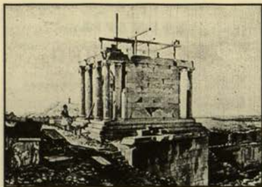
Η πρώτη αναστήλωση του ναού της Αθηνάς Νίκης, 1835-1836.

κού Μουσείου και που ακόμη η «πεπολιτισμένη» Ευρώπη αρνείται την επιστροφή τους στην πατρίδα τους, στο χώρο τους, στο φως της Αττικής.