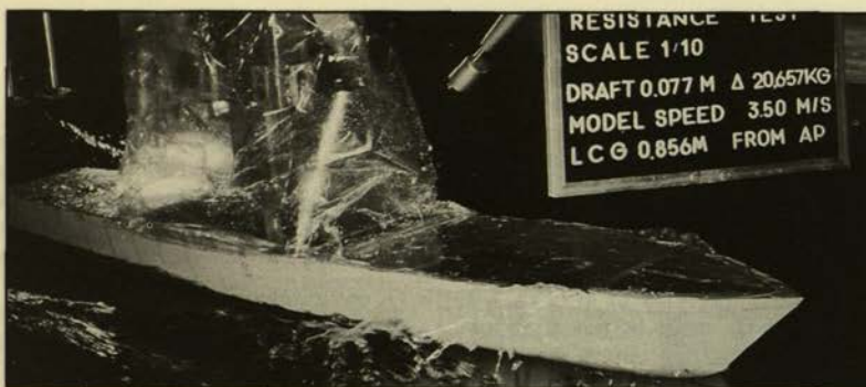
Το πρότυπο ολισθακάτου με βαθύ V κατά τη διάρκεια των δοκιμών στην Πειραματική Δεξαμενή του ΕΜΠ.