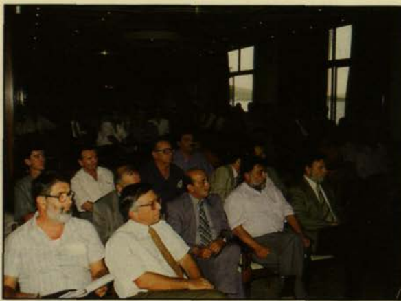
Από τις εργασίες του Συνεδρίου

εάν δεν υπάρχει το πακέτο Ντελόρ. Ήδη υπάρχει μια αντίστροφη πορεία στην Ελλάδα, μια πορεία που αρχίζει με ελπίδα. Έχουμε πια την ελπίδα ότι μπαίνουμε σταθερά σε μια περίοδο ανάπτυξης, καλύτερεύουν τα πράγματα, ελπίζουμε ότι δεν θα χειροτερεύσουν, υπάρχουν ασταθείς ισορροπίες, αλλά είναι ορατή πλέον η πορεία προς τα εμπρός, προς τη βελτίωση των πραγμάτων, άρα και αν τα κοινοτικά λεφτά τελειώσουν κάποια στιγμή, έχουμε αρκετά δημόσια χρήματα διαθέσιμα, για να συνεχίσουμε τις προσπάθειές μας.