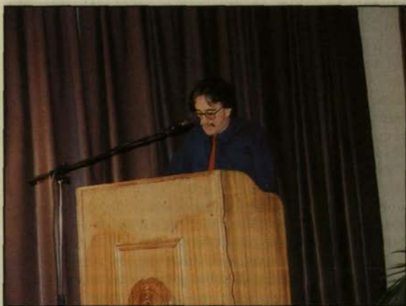
Από τις εργασίες του Συνεδρίου

Σημείο έκτο. Υπάρχουν και τα κεφάλαια; Υπάρχουν. Αυτή τη στιγμή κοινοτικά, μεθαύριο περισσότερο ελληνικά,