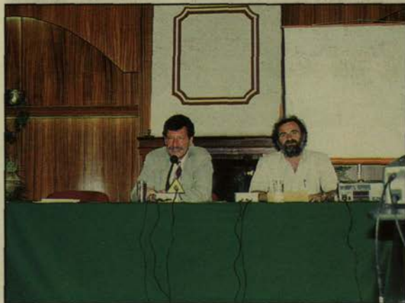
Από τις εργασίες του Συνεδρίου

Σημείο πέμπτο. Οι τεχνολογίες. Αειφορική ανάπτυξη,