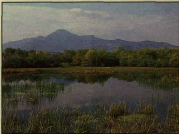
Ζώνη πλημμυρών Λούρου

Επομένως, αυτό θα πρέπει να γίνει σε πολύ σύντομο χρόνο. Απλώς θέλουμε μια βοήθεια και όταν λέω θέλουμε,