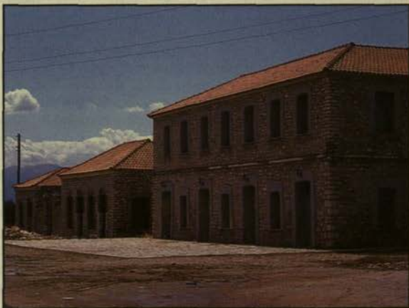
Μουσείο Φυσικής Ιστορίας Κόπρυνας

Όσον αφορά τους διαχειριστικούς φορείς, είναι ένας προβληματισμός που δεν αφορά μόνο τον Αμβρακικό Κόλπο. Η σύμβαση Ραμσάρ όσον αφορά την Ελλάδα, συμπεριλαμβάνει ένδεκα υγρότοπους. Να λάβετε υπόψη σας ότι είναι υπό εξέλιξη και η συγκρότηση αντίστοιχων