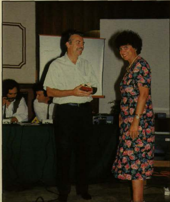
Από την τελετή απονομής μεταλλίων

Τρίτη πρόταση. Ανάπτυξη εξαγωγικών αγορών. Μπορεί να πουλάμε στη διπλανή πόλη, ή μπορεί να πουλάμε στο εξωτερικό, ή στην Αθήνα, αλλά να εξάγουμε προϊόντα έξω από την τοπική μας αγορά, τοπικά προϊόντα, με βάση τη μεθοδολογία της ανάπτυξης, μικρών τοπικών αγορών. Υπάρχουν αυτές οι μεθοδολογίες, δεν θα τις αναπτύξω εγώ φυσικά. Αλλά είναι μια διεθνής τάση ότι βρίσκουμε την αγορά εκείνη που ανταποκρίνεται στο δικό μας χαρακτήριστικό. Για κάθε προϊόν αν ψάξουμε αρκετά, υπάρχει μια αγορά που μπορεί να ανταποκριθεί στην ποιότητα και στο κόστος που προσφέρεται. Όπλο μας πάντα η ποιότητα, γιατί στην ποιότητα μια μικρή οικονομία, μπορεί αν θέλει να είναι ανταγωνιστική, απέναντι σε μια μεγάλη οικονομία.