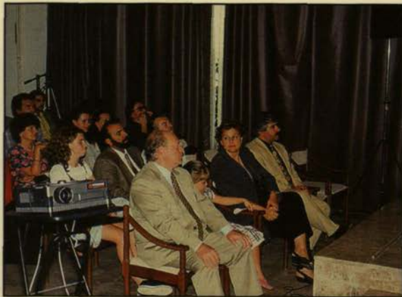
Από τις εργασίες του Συνεδρίου

μάθουν στην πόλη. Αλλά πρέπει να τους φέρεις και να τους βοηθήσεις να αποκτήσουν τις ειδικεύσεις, με τις οποίες θα μπορέσουν να ριζώσουν στο μικρό τοπικό περιβάλλον.