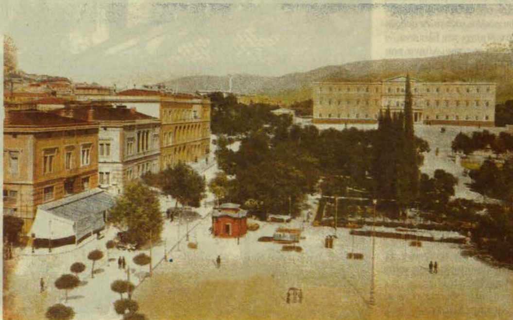
Η πλατεία Συντάγματος και τα Παλαιά Ανάκτορα (1910).

β) ΕΜΠ/ΟΡΣΑ "Διερεύνηση των δυνατοτήτων αιεφορικής (βιώσιμης) ανάπτυξης και χωροθέτησης του τομέα του τουρισμού στην Αττική"