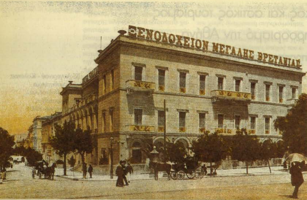
Το ξενοδοχείο «Μεγάλη Βρετανία» (1910).

[Ζαχαράτος 1988, Τσάρτας 1996]. Έτσι, όταν μετά το 1986 προέκυψε η προγραμματική έννοια των "τουριστικά κορεσμένων" περιοχών, η Αθήνα συμπεριλήφθηκε μεταξύ τους.