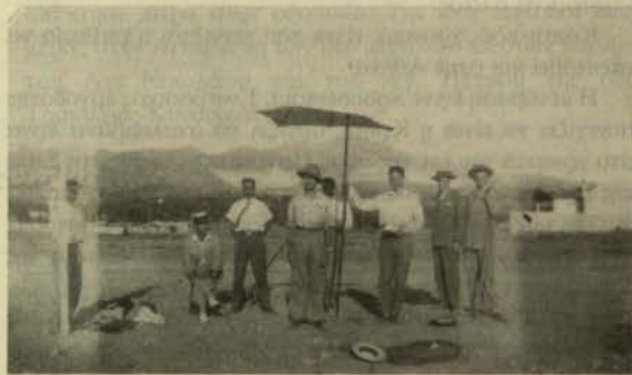
Το 1928 ανατέθηκε στην φοιτητική ομάδα του Δ. Μαυροκουκουλάκη η άσκηση της τοπογραφικής μελέτης της παρθένας ακόμα Κηφισιάς