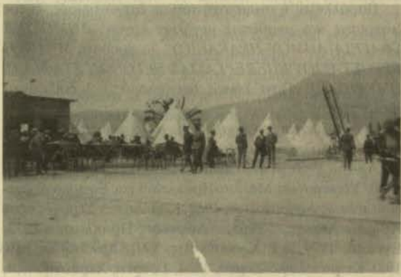
Το 1929 η εκδρομή της Σχολής έγινε στο μεγάλο σεισμό Κορίνθου Λουτρακίου. Στα αντισεισμικά αυτά έργα απορροφήθηκαν πολλοί από τους συναδέλφους.