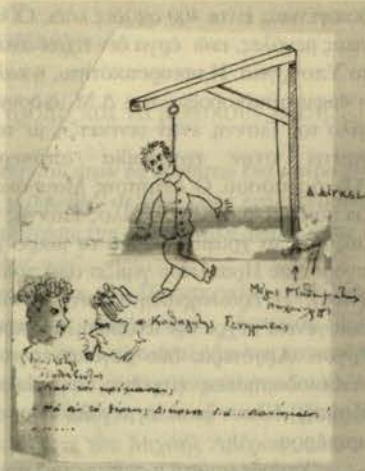
Γελοιογραφία του φοιτητή Δίγκα που σατυρίζει τους καθηγητές Γεννηματά και Τσαλαβούτα εν ώρα διδασκαλίας