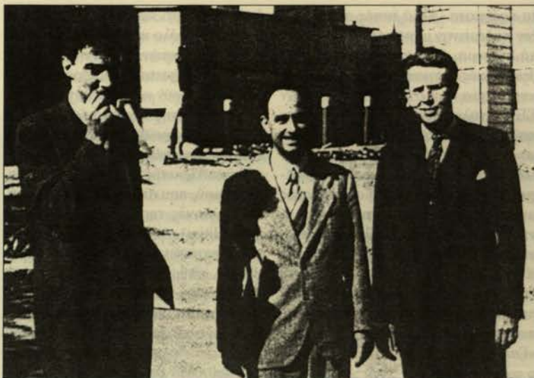
Οππενχάιμερ, Φέρμι και Λόρενς.

Το «Ισχυρό Πρόγραμμα» διαμορφώθηκε στο εσωτερικό του κλάδου των ΣΕΤ, όπως είχε δομηθεί με τους παραπάνω τρόπους. Εκεί είχε και τις πρώτες κερηκτικές επιπτώσεις του, δηλαδή εκείνες που οδήγησαν τα περισσότερα προγράμματα ΣΕΤ να τροποποιήσουν τους στόχους τους και να συγκεντρώσουν τις δυνάμεις τους σε σπουδές επιστήμης του είδους που ήδη αναφέραμε. Οι συνέπειες, όμως, αυτής της έκρηξης αποδείχθηκαν πολύ ευρύτερες. Οι νέοι τρόποι προσέγγισης της